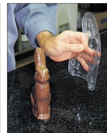
... zeigt sich, ob das Werk gelungen ist. Das Resultat ist perfekt.