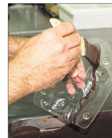
Ein Chilihase entsteht: Die Augen werden geschminkt und ...